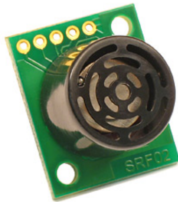
شکل شماره (1)

برای ارتباط با این ماژولها باید دو بیت را به ترتیب به ماژول (یا ماژولها) ارسال کنیم که اولین بیت حاوی کد یا نام ماژول از 0 تا 15 بوده و برای انتخاب ماژولی که میخواهیم با آن ارتباط برقرار کنیم به کار می رود. بیت دوم کد مربوطه تعیین نوع عملکرد ماژول می باشد که در جدول شماره 1 آمده است.